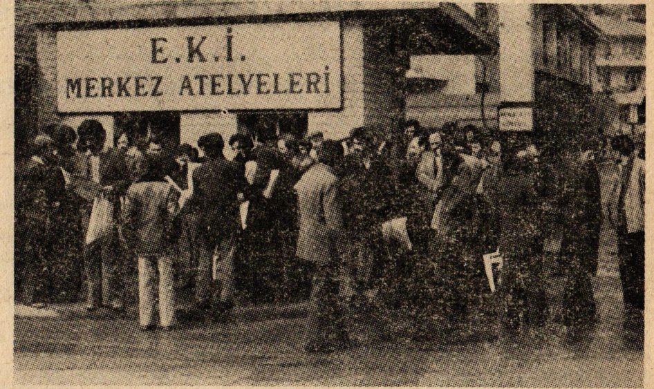
Elli Bin maden işçisini mücadeleye çağıran öncü Atölye işçileri işyeri kapısında görülüyor.

Öncü atölye işçileri hemen işe koyuldular ve arkadaşlarının isteklerini tespit etmeye başladılar. Öncü işçiler sözleşme konusundaki görüşlerini EKİ de çalışan bütün işçilere duyurmaya çalışıyor. Elli bin işçiye seslenmek üzere öncü işçiler bir taslak hazırladılar. «Giriş» ve «İstekler» diye iki bölüm halindeki bu taslağı aşağıda yayınlıyoruz.