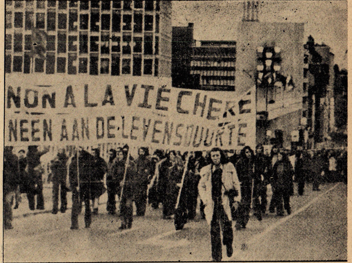
Silahlanmayı protesto eden Belçika işçileri.

«Vietnam bize yirminci yüzyılın ikinci yarısında silahlı beyaz adamların artık üçüncü dünya devletlerinin geleceğini tavin edemeyeceğini öğretti... Dünyada