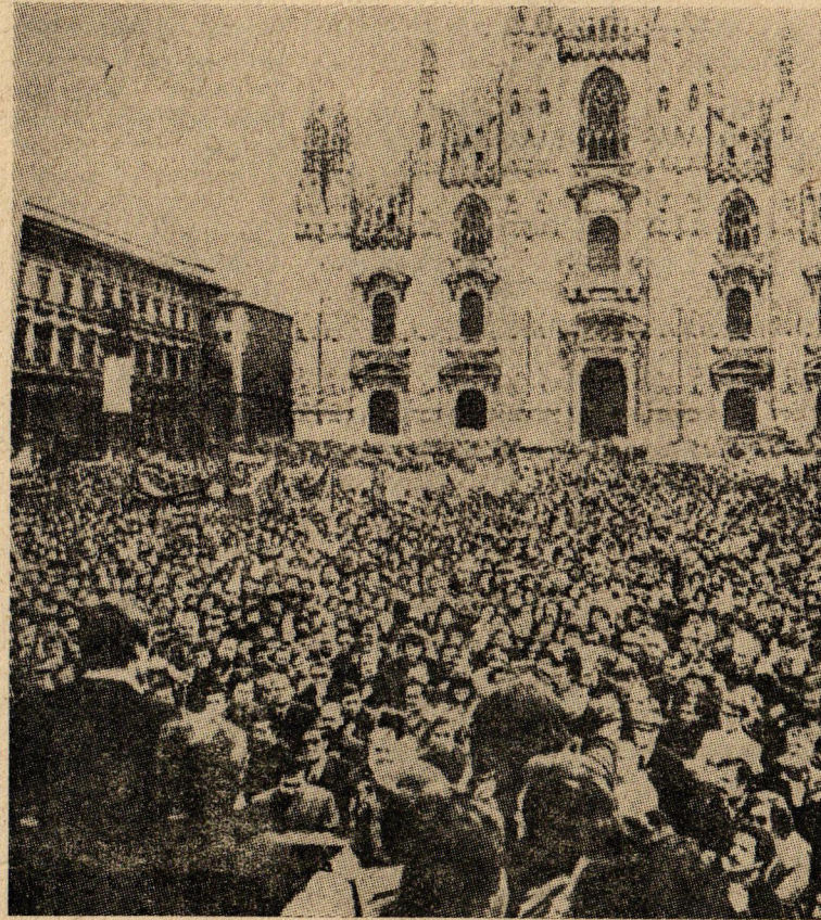
İtalya'da onbinlerce işçi kapitalizmi protesto etti.

Sosyalist ülkeler kaynakların insanların refahı için kullanılmasına ça-