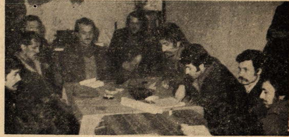
E.K.İ. Merkez Atölyesi İşçilerinden bir grup görüşlerini gazetemize açıklarken.

Sovyetler Birliğinde işçiler için koruyucu tedbirlerin alınması, üretimin de artmasında yardımcı olmaktadır. Halen Sovyetler Birliği yılda 700 milyon ton kömür üreterek dünyada birinci sırada yer almaktadır.