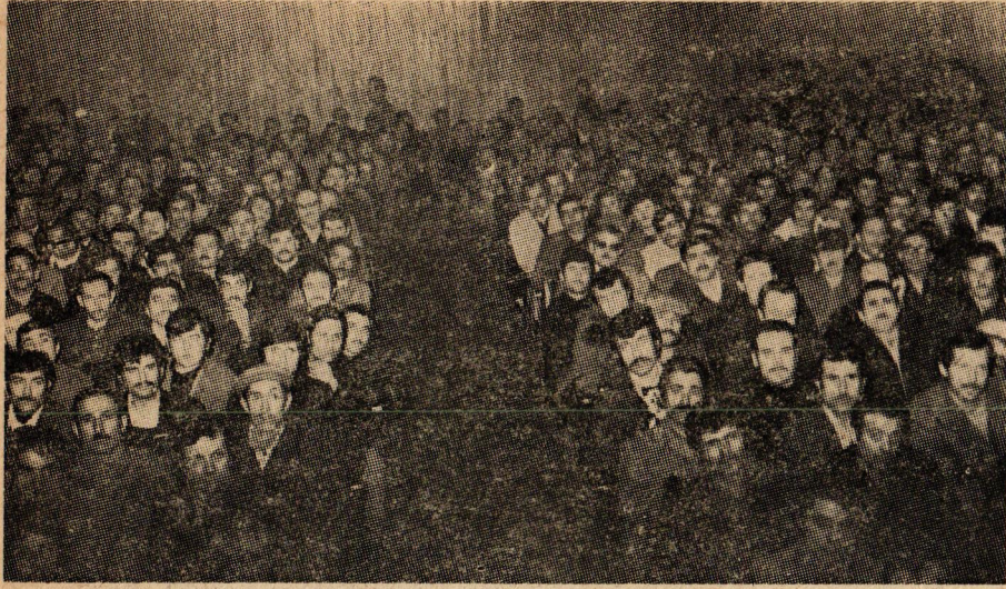
Hürcam-İş'in daha önce Gebze'de yaptığı toplantıdan bir görünüş.